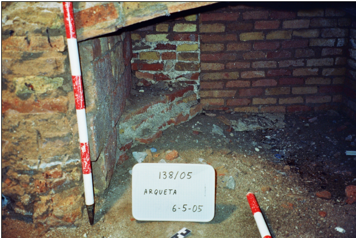
Figura 7. Dipòsit. Panoràmica de la zona S.