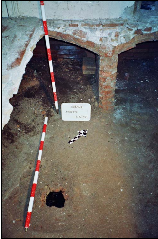
Figura 3. Detall del dipòsit i desguàs.