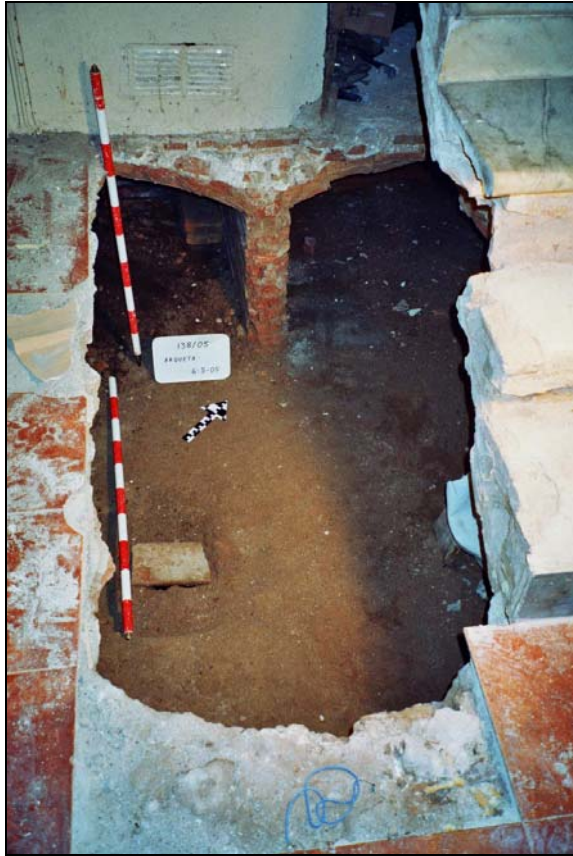
Figura 1. Panoràmica cala realitzada.