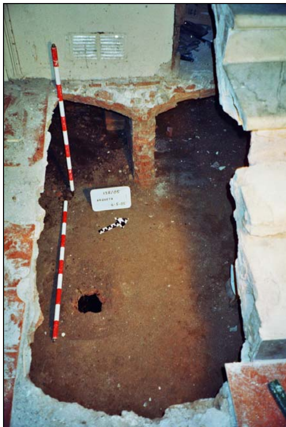
Figura 2. Panoràmica cala realitzada.