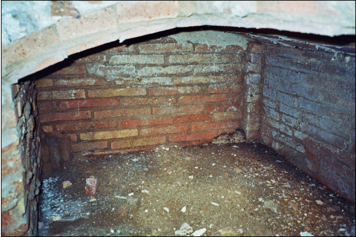
Figura 5. Dipòsit. Panoràmica de la zona NW.