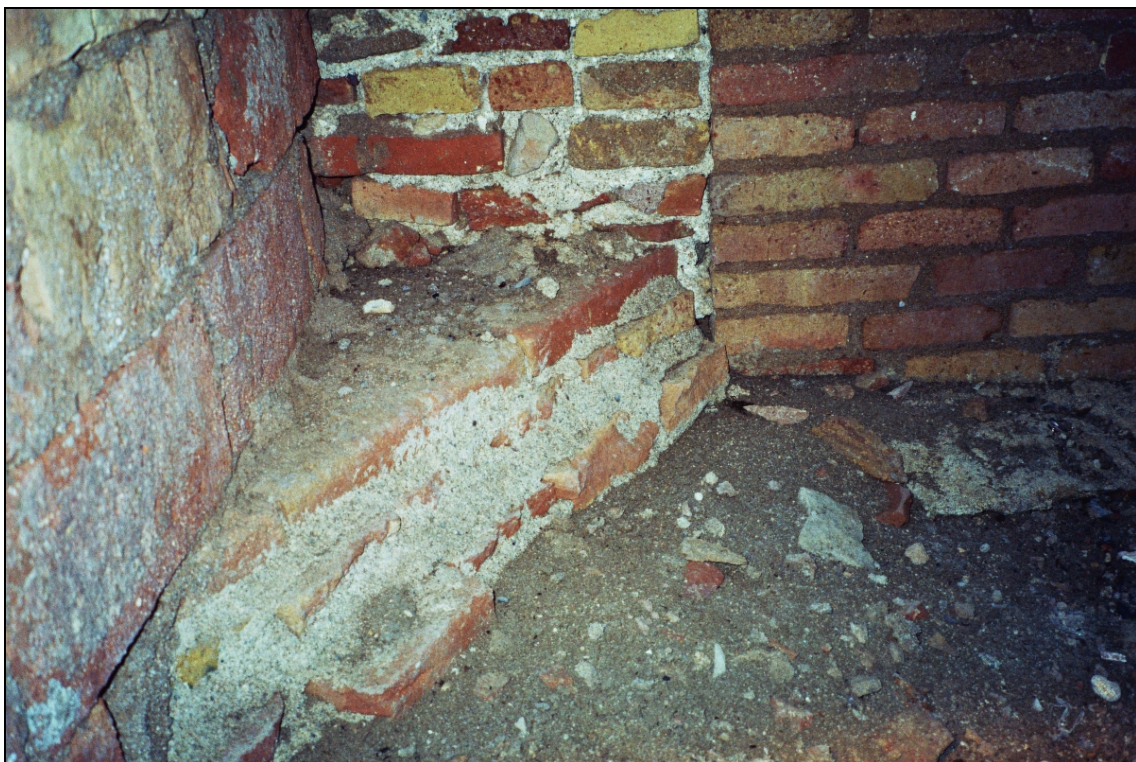
Figura 8. Dipòsit. Detall cantonada SE.