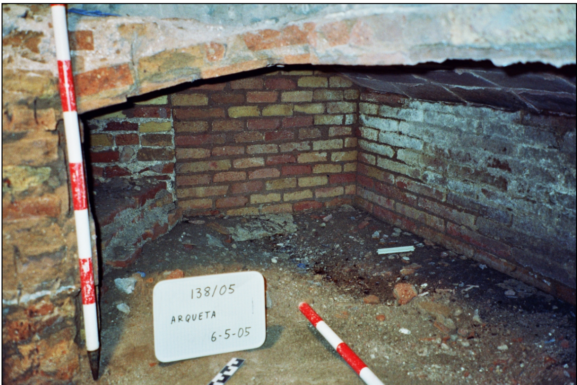
Figura 6. Dipòsit. Panoràmica de la zona S.