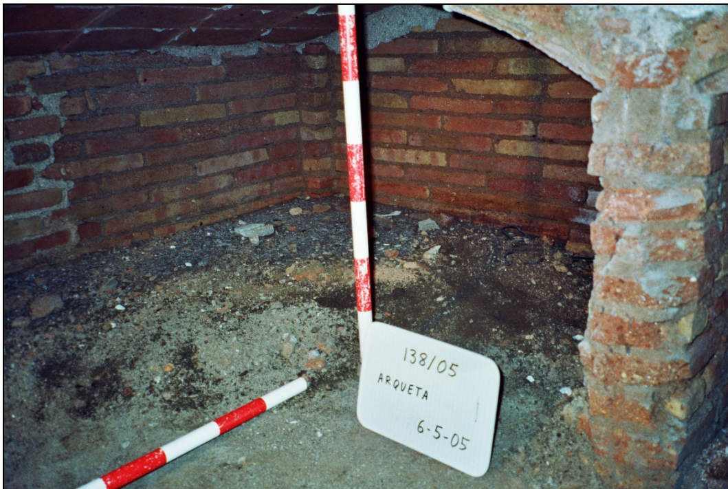
Figura 4. Dipòsit. Panoràmica de la zona W.